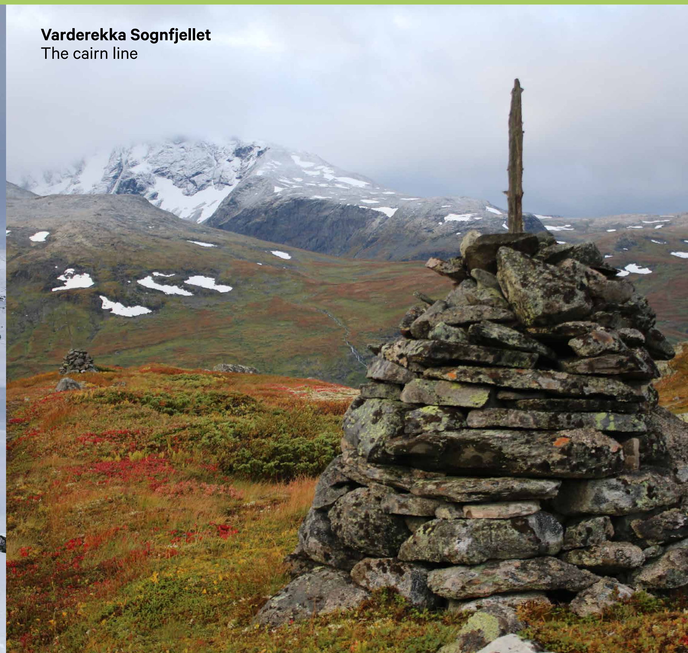
Varderekk Sognfjellet The cairn line