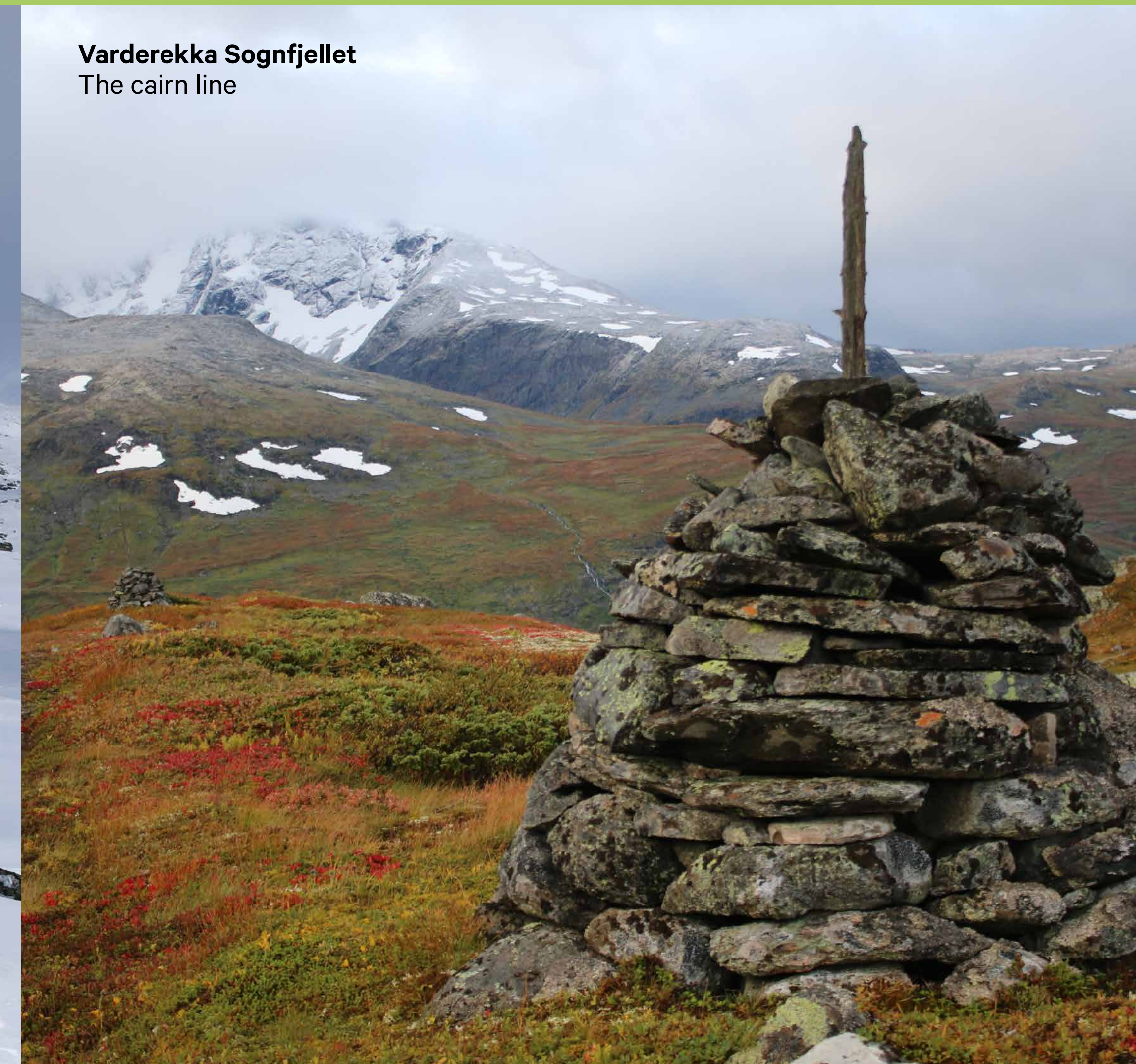
Varderekka Sognfjellet The cairn line