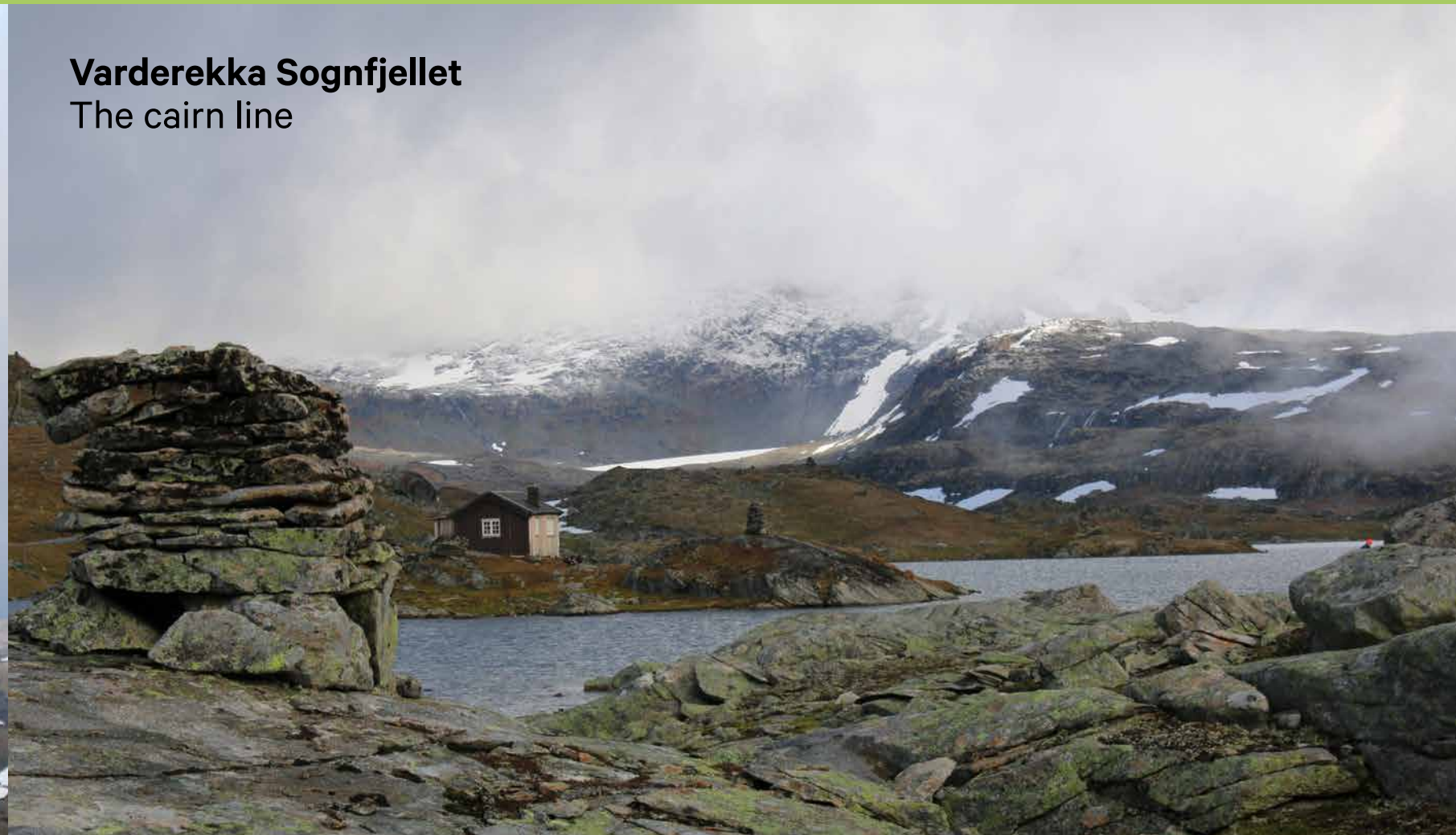
Varderekka Sognfjellet The cairn line