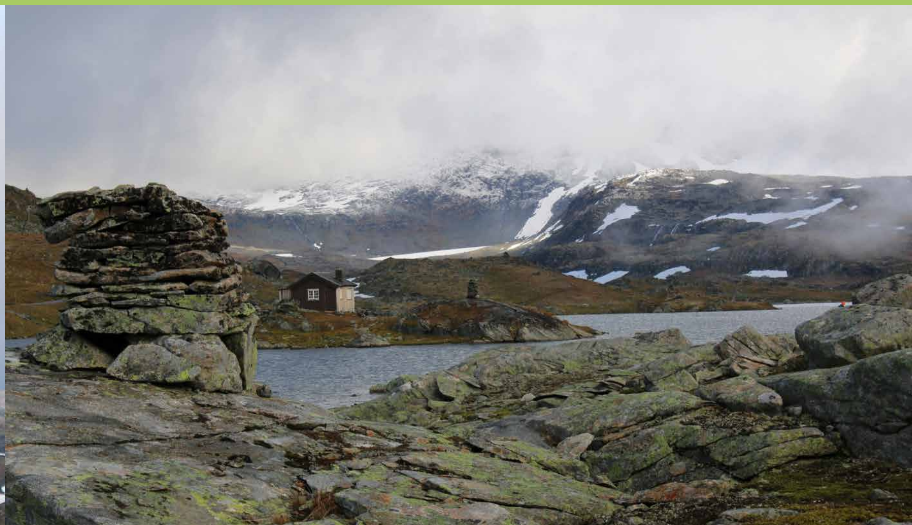
Varderekka Sognfjellet The cairn line