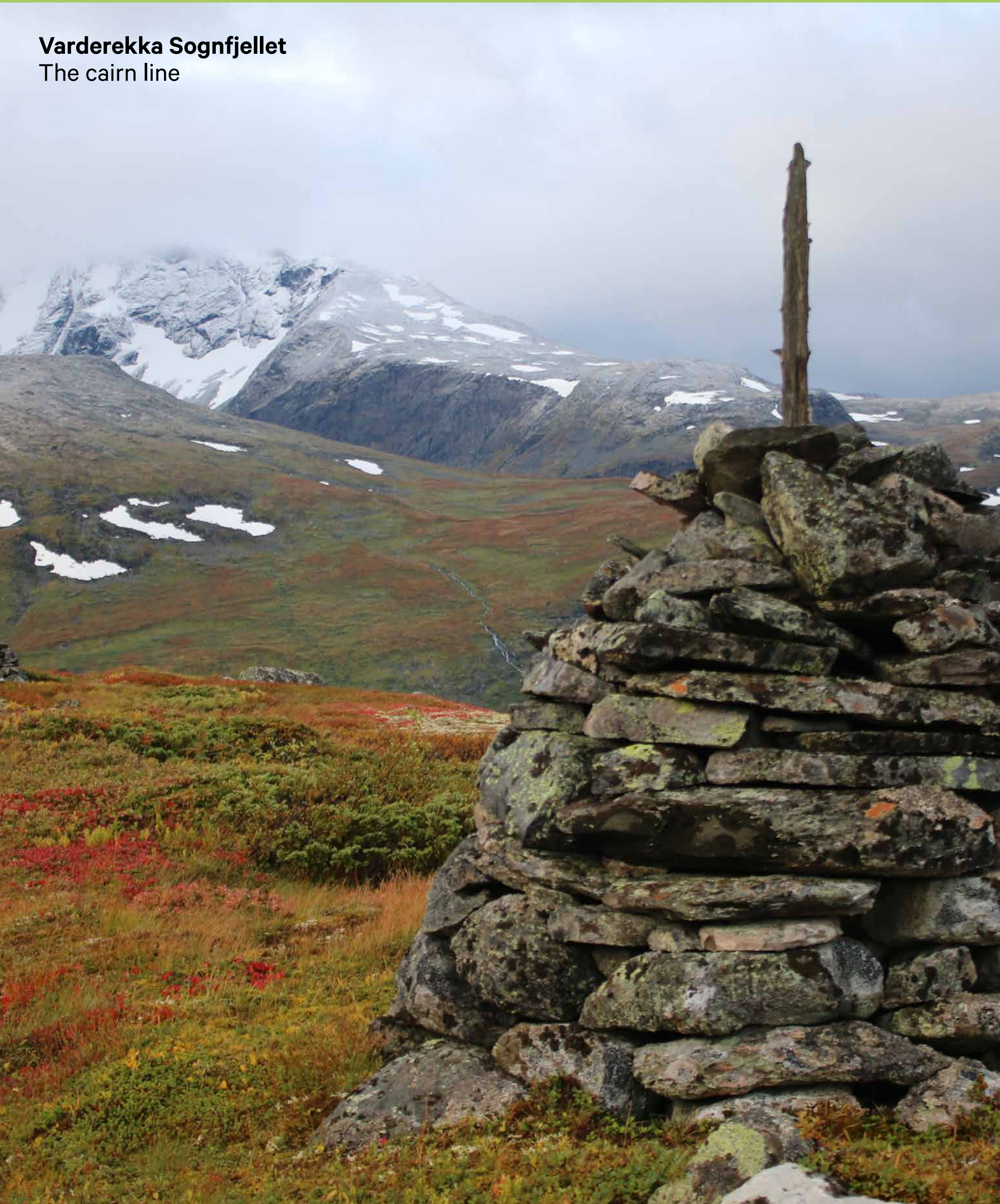
Varderekka Sognfjellet The cairn line