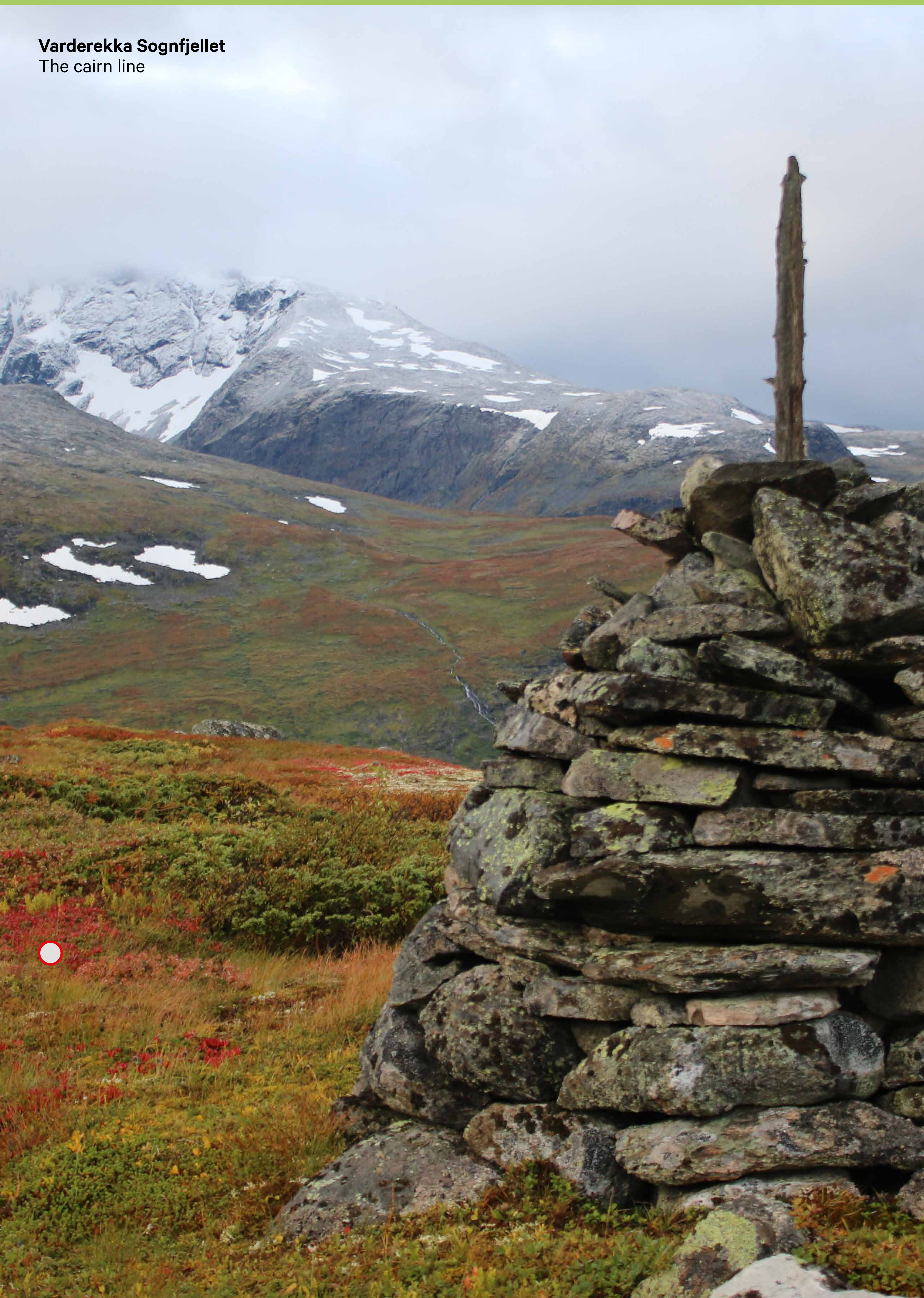
Varderekkja Sognfjellet The cairn line