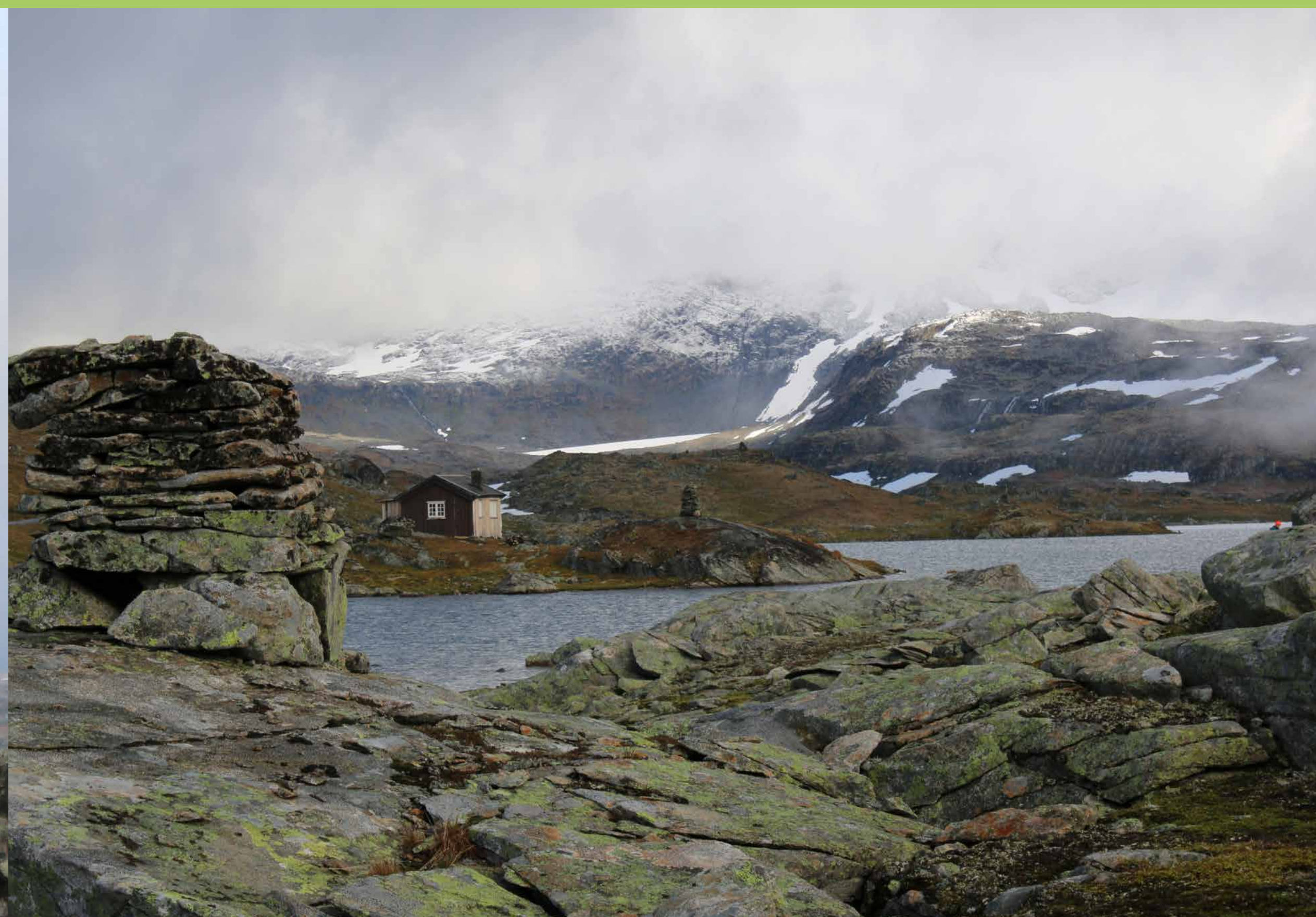
Varderekka Sognfjellet The cairn line