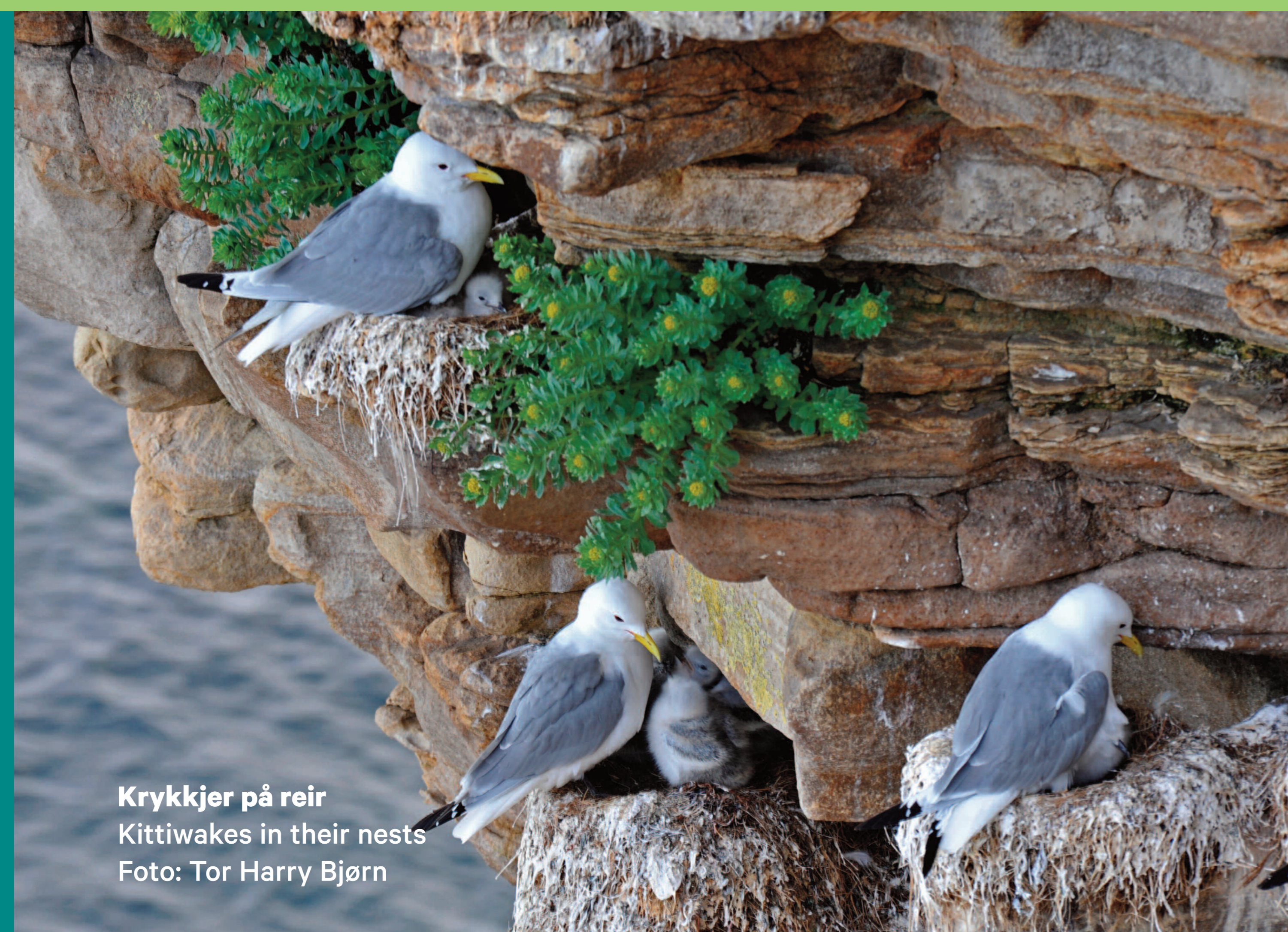
Krykkjer på reir Kittiwakes in their nests

Krykkjekolonien i Eidvågen naturreservat oppleves best fra båt, på litt avstand.