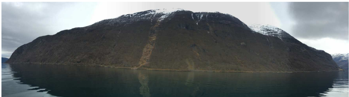
Eiterstrondi naturreservat sett frå fjorden april 2016 (vidvinkel)

Eiterstrondi naturreservat ligg på den austlege dalsida i Arnafjorden, ein sidearm til Sognefjorden. Nede ved fjorden går reservatgrensa like over fylkesveg 92. Stølaneset er kaien og parkeringsplass til dei veglause gardane på vestsida av fjorden på Otterskreda. Den øvre grensa til reservatet går i ei høgde på mellom 500 - 650 moh.