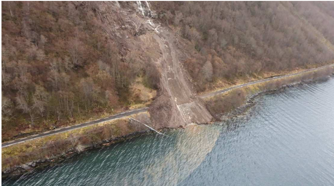
Ras på Eitrestrondi i 2014

Dei som bur i og vitjar området/kommunen bør få informasjon om at naturreservatet eksisterer, kva verneverdiane er og kva alternative måtar for å «oppleve området» som finst. Informasjon bør vere tilgjengeleg både før folk reiser til kommunen og under opphaldet. Merkevarerstrategien for nasjonalparkar og andre verneområde skal takast i bruk. Det er eit også mål å kunne introdusere ein ny brukargruppe til naturreservatet: forskarar. Det er eit mål å auke aksept og forståing for naturreservatet blant grunneigarane.