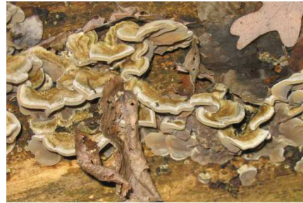
Skrukkeøre, ein tresopp og raudlisteart som er registrert på Eitrestrondi

Sidan det i fråværet av gode stiar normalt ikkje er ferdsel i området, er det truleg fyrst og fremst klimaendringar, framande arter og sjukdom på tre som må reknast som aktuelle truslar for dei sårbare naturverdiane eller verneverdiane.