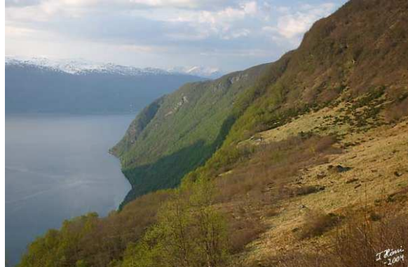
Utsikt til Eitrestrondi frå Dragsbotnen

Det er truleg få som ferdast i sjølve naturreservatet, pga. få stiar og rasfare i store delar av området. Det er mogleg å oppleve naturreservatet frå sjøen. Lokalbefolkninga og tilreisande står for ein del aktivitet på sjøen med kajakk, kano eller båt. På fylkesveg 92 mellom Vik og Framfjorden køyrer ein rett nedanfor reservatgrensa. Denne strekninga blir også brukt til sykling (Vik - tunellen el. Vik - Nese t/r). Ein har utsikt til reservatet eller delar av det frå Nese, Otterskreda, frå stølsvegar og turstiar på andre sida av fjorden og frå Dragsbotnen og Skoddesetet ovanfor naturreservatet. For denne indirekte opplevinga av naturreservatet er målgruppa både lokalbefolkninga og tilreisande.