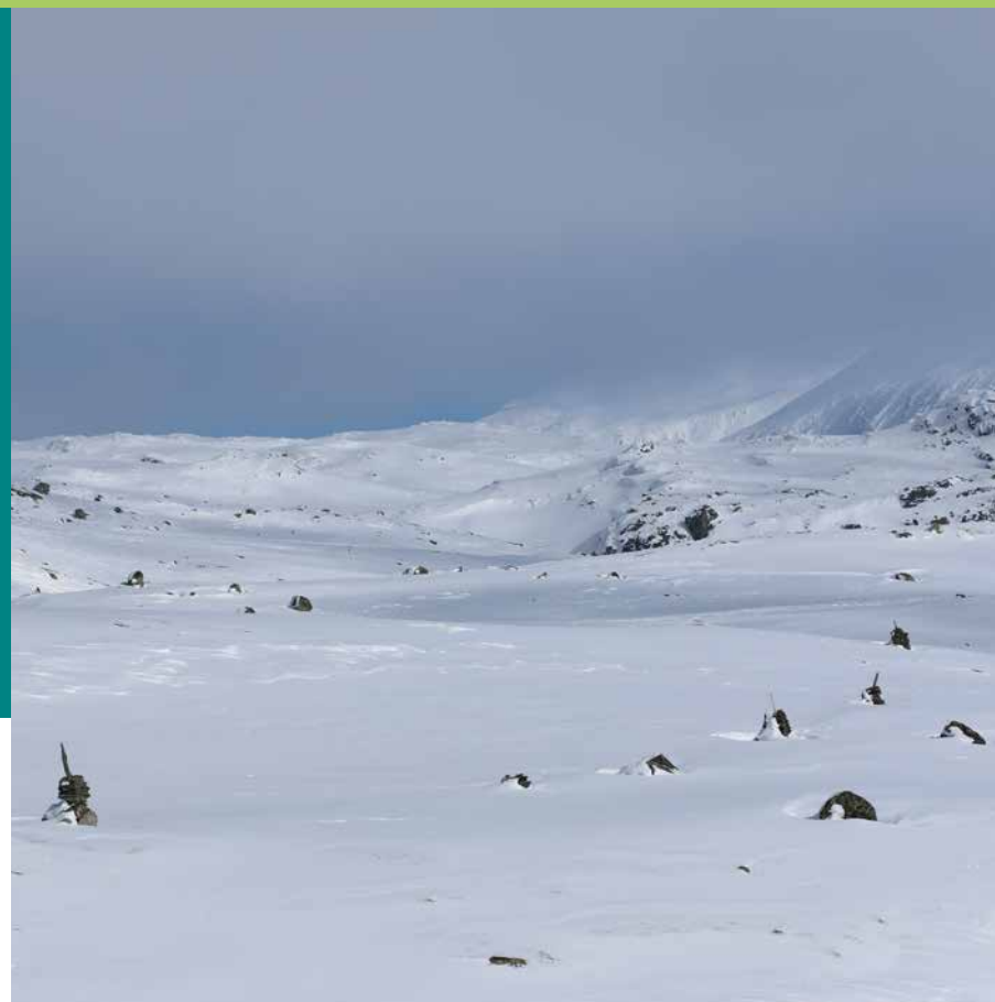
Varderekkja Sognfjellet The cairn line

På engelsk Godt oppbygde varder, gjerne med ein solid staur i midten som ruver høgt over varden, gjorde at dei kunne reisande sjå frå varde til varde – også når skodde og uvær kom sigande innover fjellmassivet. Vardane har hatt mykje å si for trygg ferdsel over fjellet gjennom fleire hundre år. Over ei strekning på ca. 16 km mellom Krossbu og Turtagrø kan du fortsatt følgje den gamle ferdselsåra mellom Lom og Luster, fram til bilvegen kom i 1938. I alt er det registrert over 300 vardar på denne strekninga. Vardevegen er eit viktig kulturminne, som ikkje må endrast eller øydeleggast på noko vis. Dette betyr også at det ikkje må byggast nye vardar, som vil forstyrre samanhengen mellom dei gamle landemerka og forringe kulturminneverdiane.