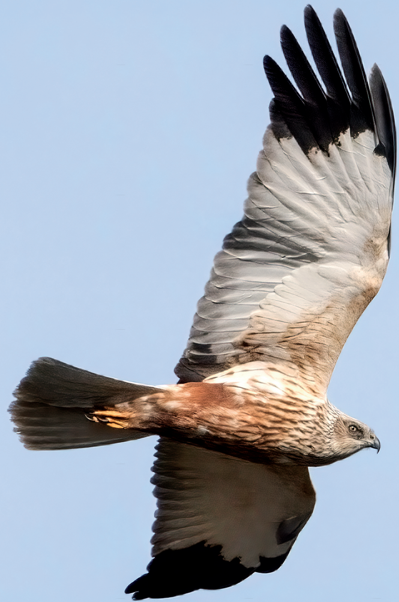
Sivhauk Western Marsh Harrier/ Rohrweihe

Wiederhergestelltes Feuchtgebiet von hoher Qualität