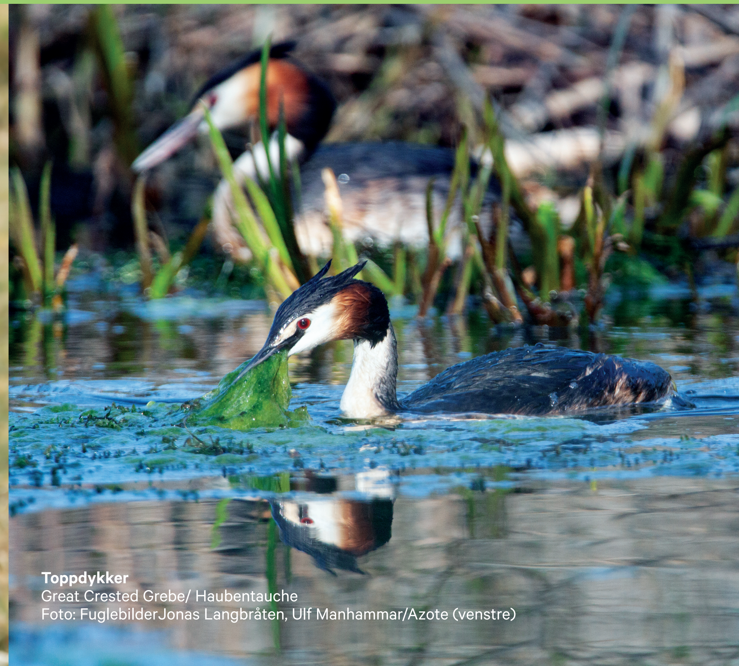
Toppdykker Great Crested Grebe/ Haubentauche