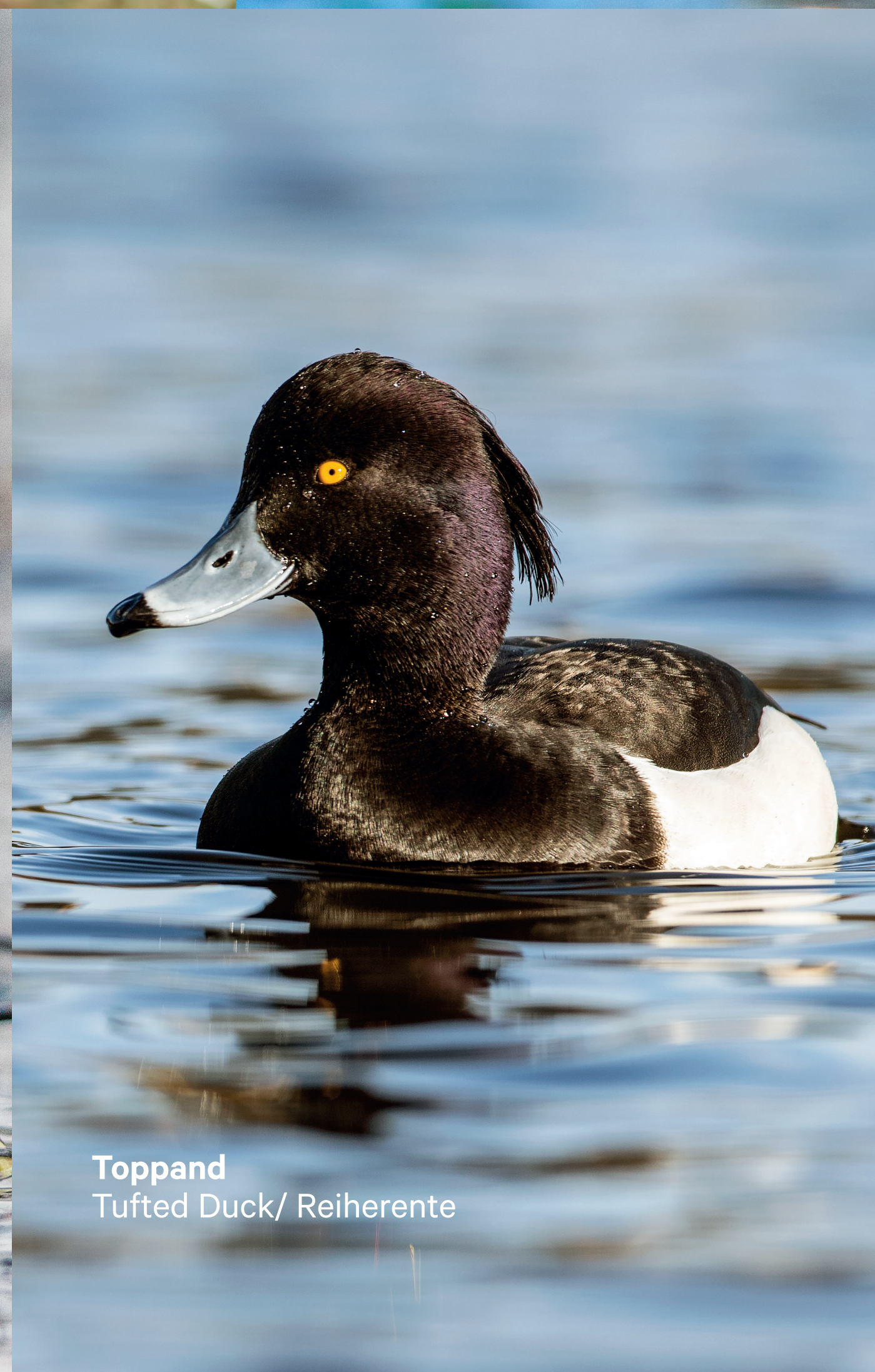
Toppand Tufted Duck/ Reiherente