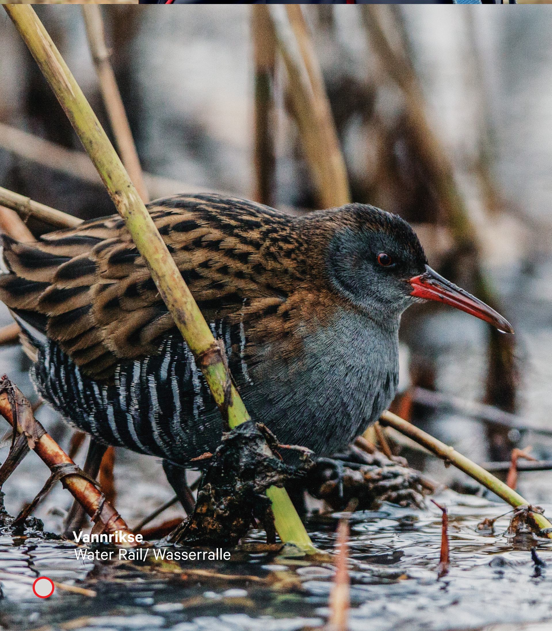
Vannrikse Water Rail/ Wasserralle