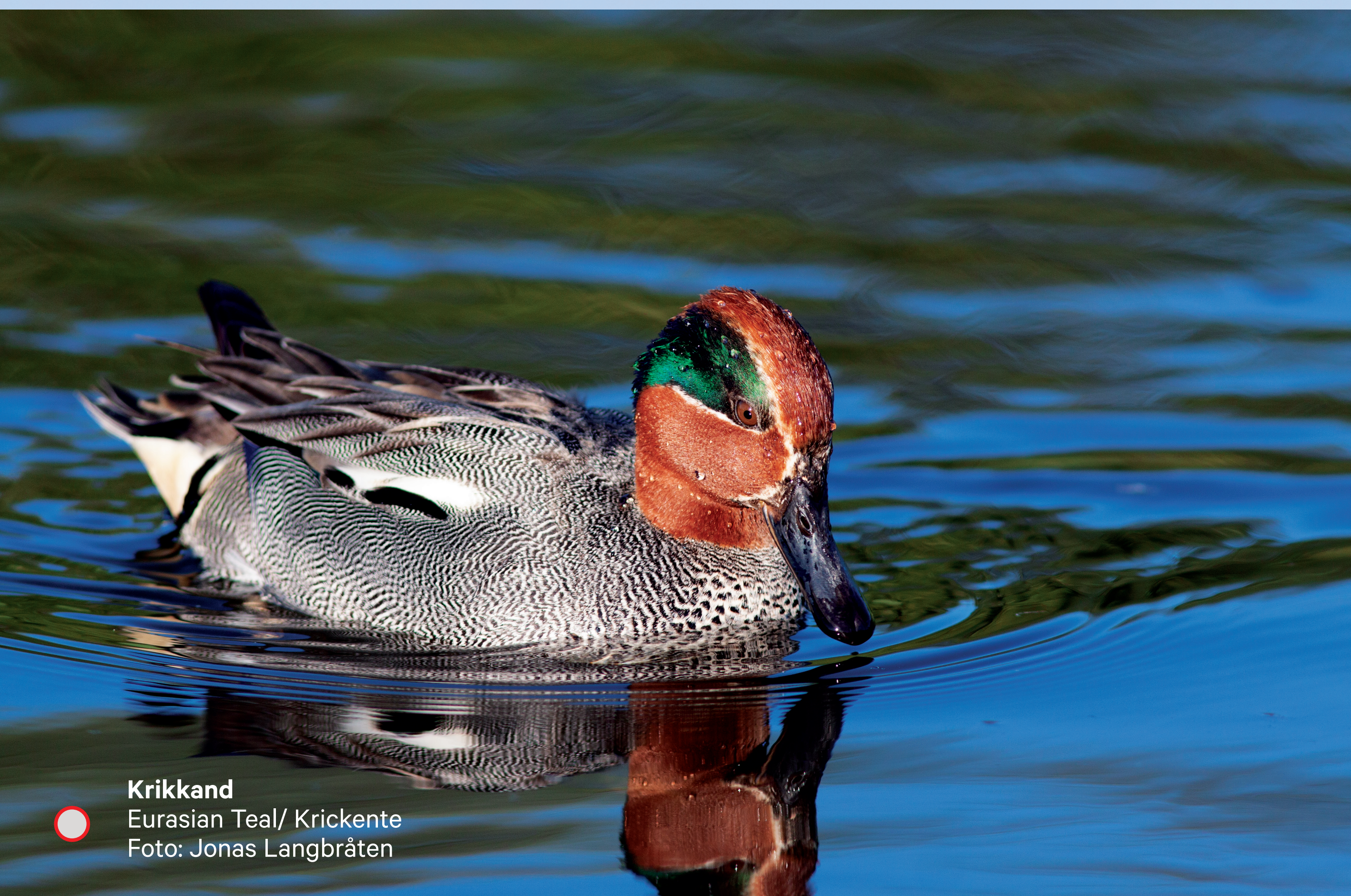
Krikkand Eurasian Teal/ Krickente

Der Kiebitz war früher in ganz Lista zahlreich anzutreffen, jedoch sank die Zahl dieser Vögel bis 2015 dramatisch. Der Slevdalsvann ist vielleicht die letzte Chance der Kiebitze in Lista. Glücklicherweise scheinen sie sich hier nach der Wiederherstellung wohl zu fühlen. Im Herbst sammeln sich oft mehrere hundert Krickenten auf dem Wasser. In den Sommermonaten kreist die Rohrweihe auf der Jagd nach Beute über dem Schilfrohrwald.