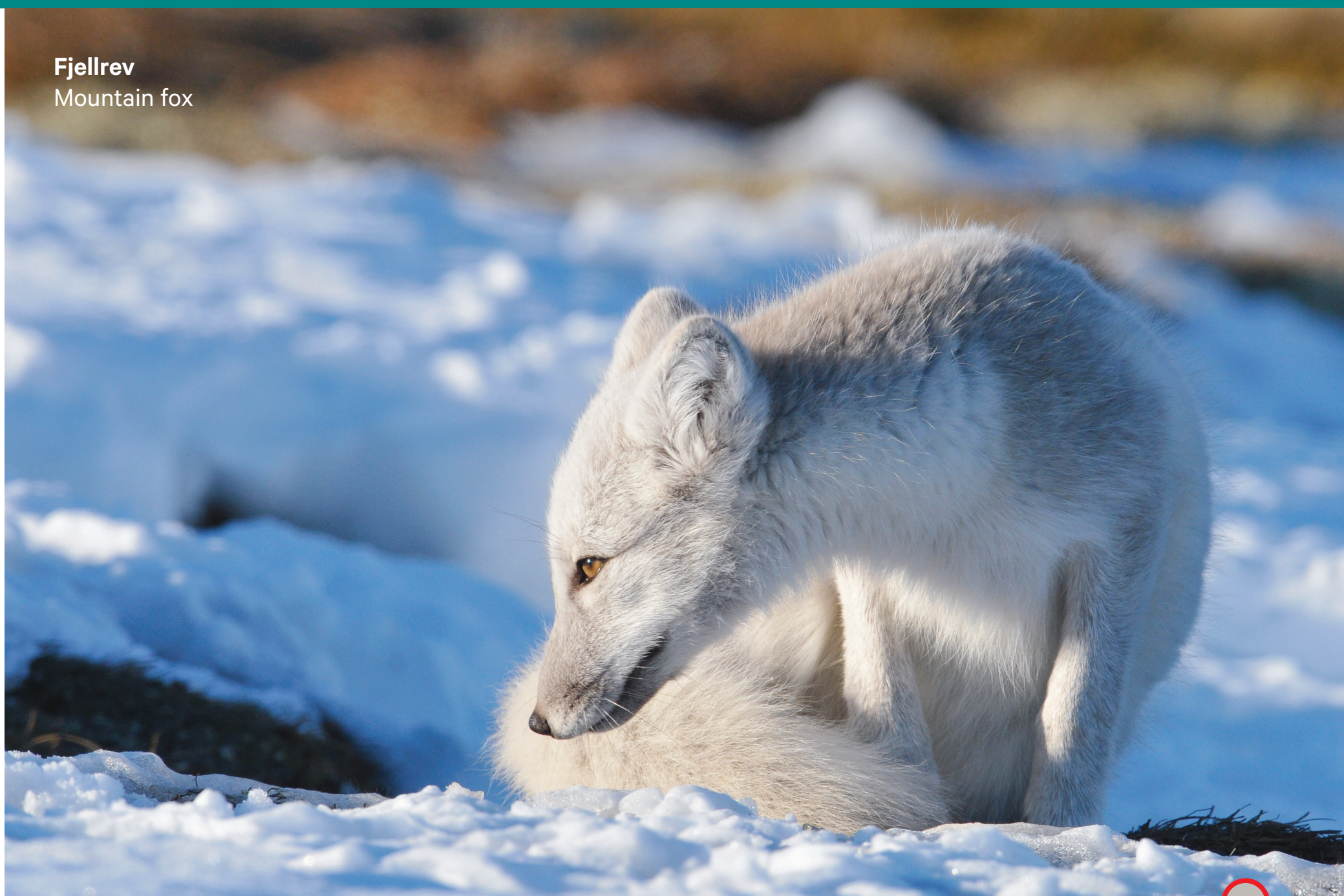
Fjellrev Mountain fox