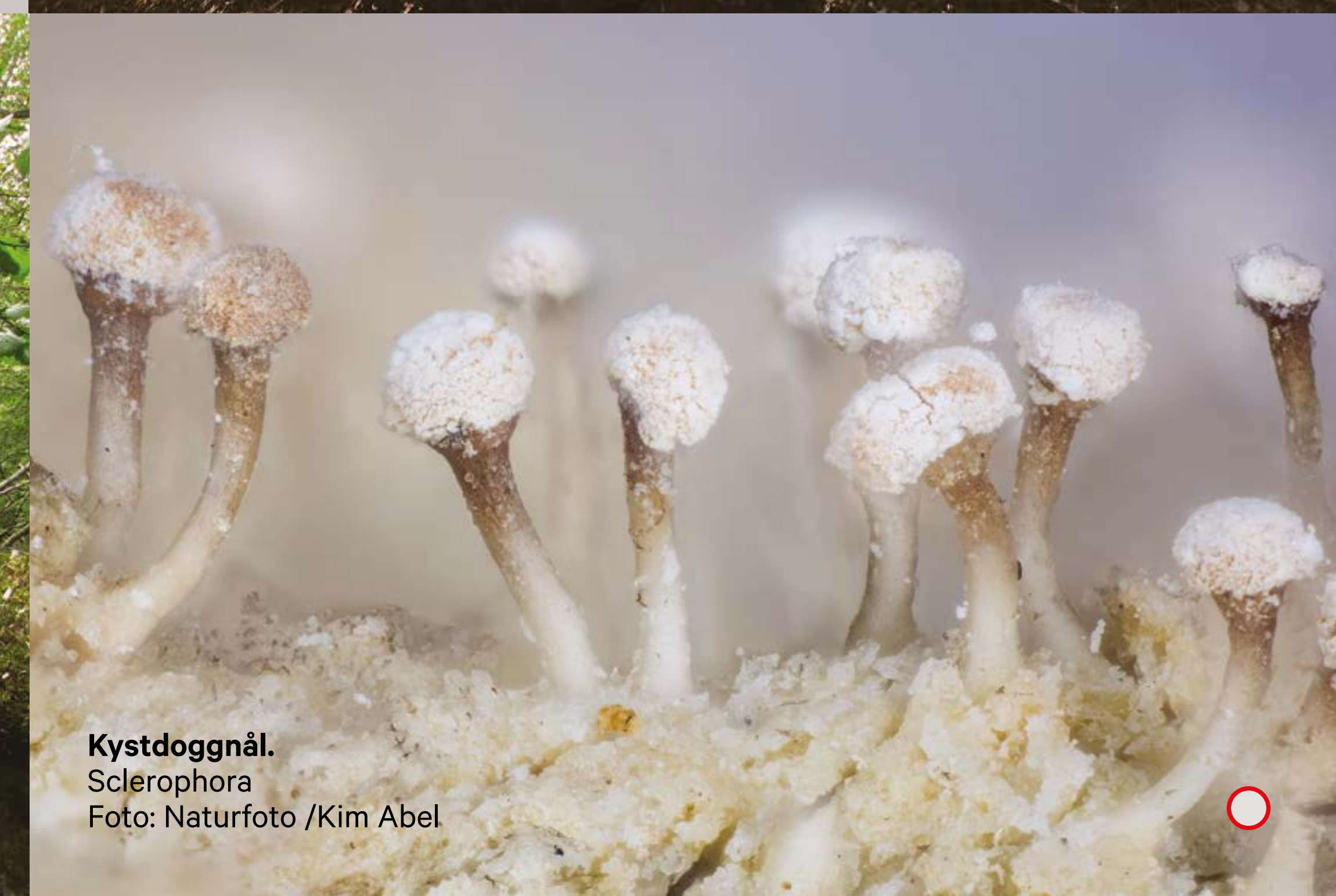
Kystdoggnål. Sclerophora